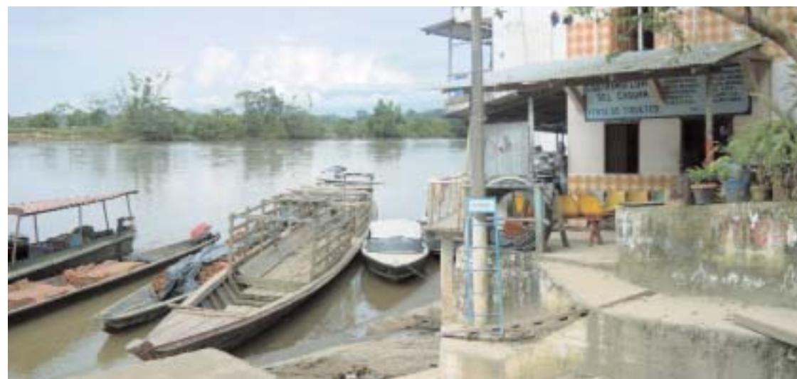
Sopra: Il porto fluviale di San Vicente del Caguan. Da qui passano tonnellate di coca base e di cocaina destinate agli Stati Uniti.

Una scritta nel territorio indigeno del Cauca controllato dalle Farc. Sulle montagne colombiane la coca si può comprare come l'avena o l'erba medica, un tanto al chilo. I contadini colombiani la usano da millenni.