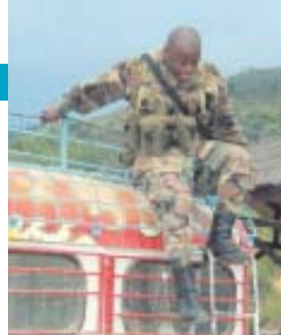
Soldato controlla una chiva: all'interno del Paese le perquisizioni sono sempre più frequenti.

Di chi era la mano? L'operazione era stata ideata e diretta dal ministro degli Esteri, de Villepin, di cui, all'Università, la brillante giovane Betancourt era stata una delle allieve preferite e forse - secondo Le Monde e alcune indiscrezioni che girano negli ambienti diplomatici di Bogotá - "qualcosa di più". Chi aveva interesse a rompere le uova nel paniere all'ambizioso de Villepin, a cui forse la liberazione di Ingrid Betancourt, popolarissima in Francia (nei