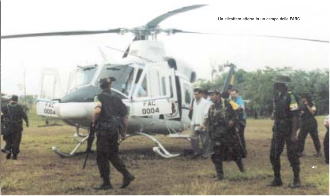
Un elicottero atterra in un campo delle FARC